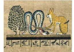
Serpent Apophis combattu par Râ ayant pris la forme d'un chat. Egypte