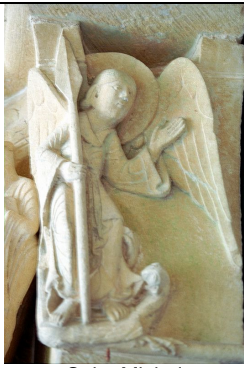
Saint Michel Perrecy 12 ème s. Narthex De son geste élégant, St Michel, serein et maintenant sous ses pieds le dragon, semble vous inviter à écouter cette conférence.