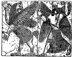
Tiamat combattue par Marduk (Babylone) Sumériens 1700 avant JC